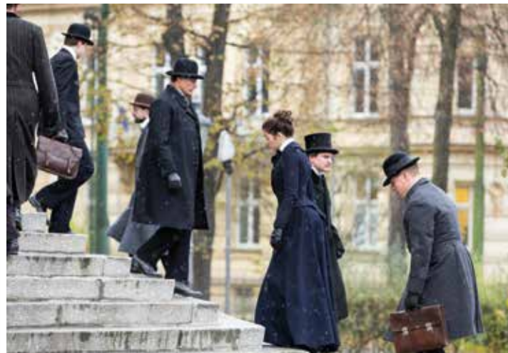
Snímek z natáčení před Severočeským muzeem.