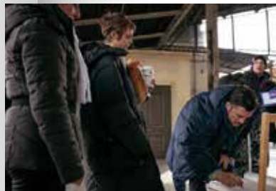
Orlando Bloom a Cara Delevingne se podepsali do kroniky města Liberce.