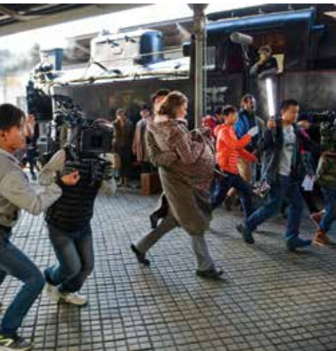
Snímky z natáčení na libereckém vlakovém nádraží.