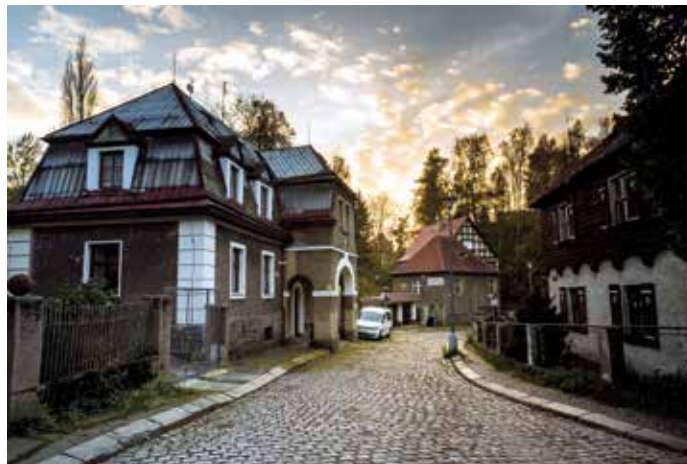
náměstí Pod Branou