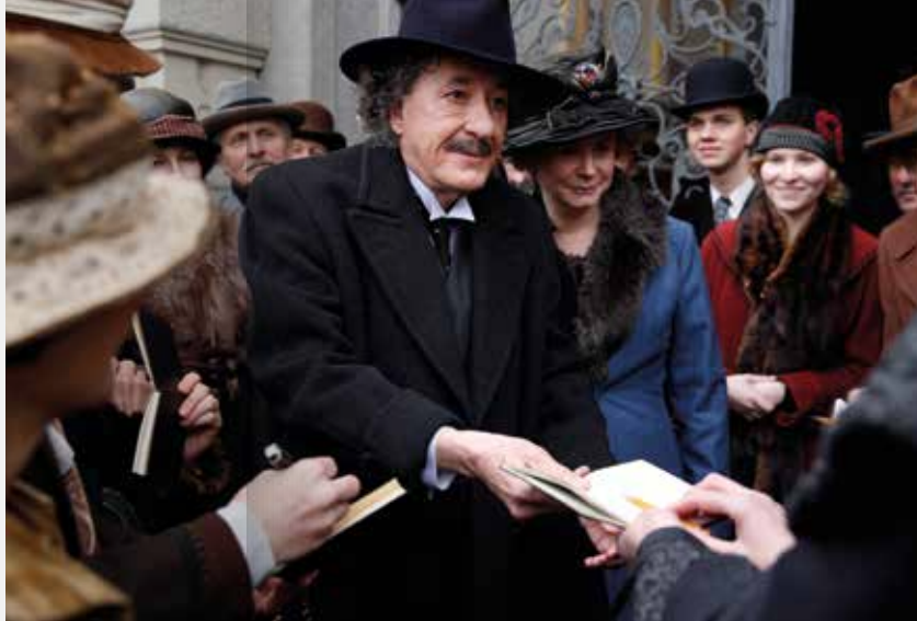
Shímky z natáčení v liberecké radnici.