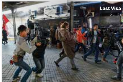
Last Visa 2015