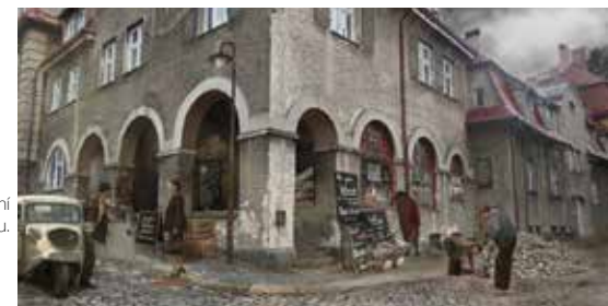
Vizualizace pro natáčení na nám. Pod Branou.

Německá televize ZDF na náměstí Pod Branou a na vlakovém nádraží v Liberci zfilmovala oceněný román Ursuly Krechel o dojemném příběhu. Film vypráví osud židovsko-křesťanské rodiny Kornitzer, která si po exilu a pronásledování v době nacismu pokoušela vybudovat nový život v Západním Německu.