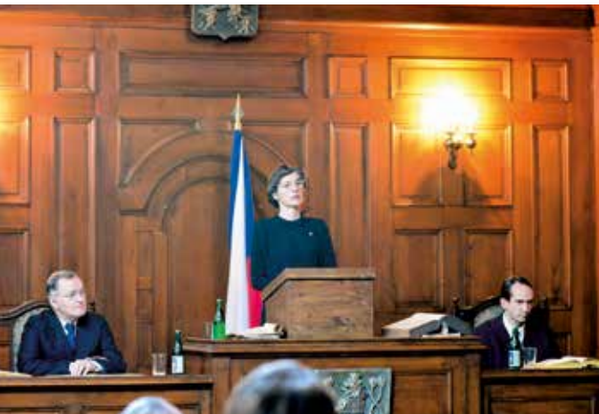
Snímky z natáčení v obřadní síni liberecké radnice.