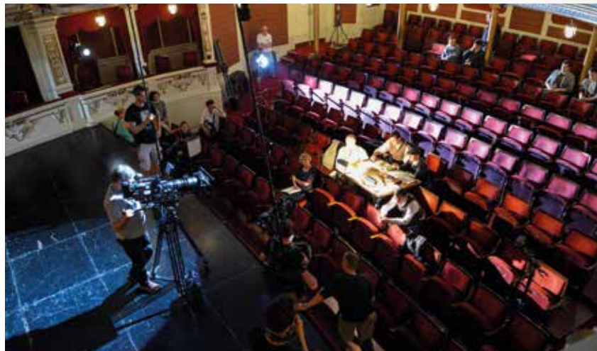
Snímky z natáčení v Divadle F. X. Šaldy.