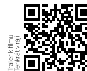
Trailer k filmu Tenkrát v ráji