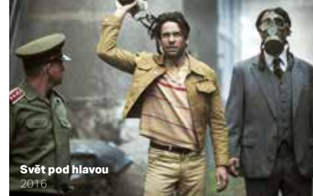
Svět pod hlavou 2016