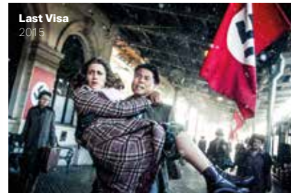
Last Visa 2015