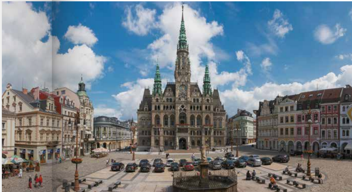
Liberecká radnice architekt Franz von Neumann realizace 1888–1893