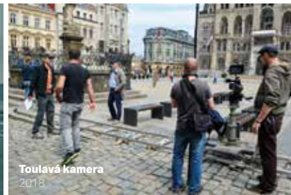
Toulavá kamera 2018