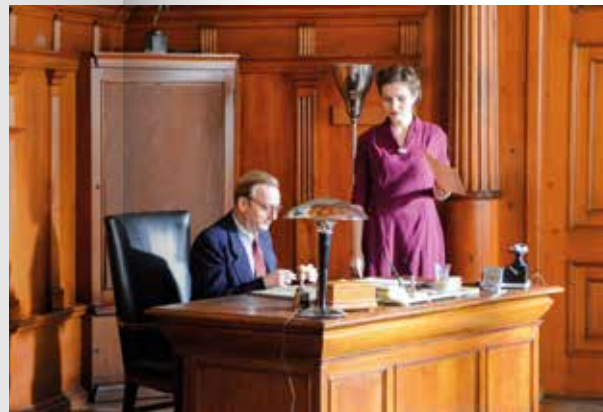
Snímek z natáčení v primátorském salóнку.