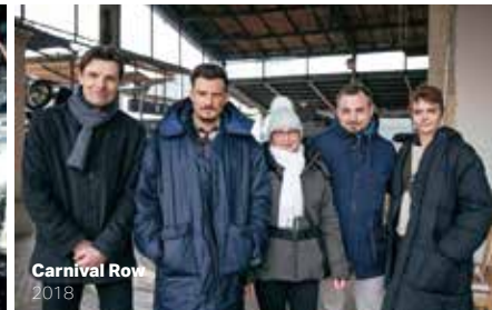
Carnival Row 2018