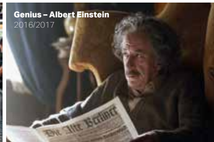
Genius - Albert Einstein 2016/2017