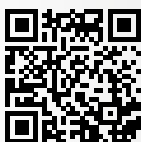
Trailer k filmu Milada